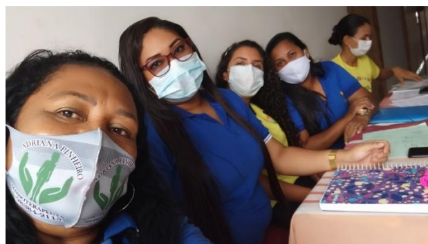
Reunião para retorno das atividades da APAE (14/02/2022)

No dia 15/02 iniciamos os atendimentos ofertados presencialmente com abordagem em âmbito preventivo e de orientações diversas , com algumas restrições, se fez necessário o uso de máscaras, assepsia das mãos, uso de álcool ou gel, entre outras, seguindo as normas de contenção da pandemia, iniciamos com retorno gradativo, pois muitos pais/ responsáveis não se sentiam seguros com relação ao COVID-19. Entre as atividades desenvolvidas, tema como Carnaval fizeram parte de forma dinamica como pinturas e criação de adereços e atividades como danças, como mostra as imagens abaixo: