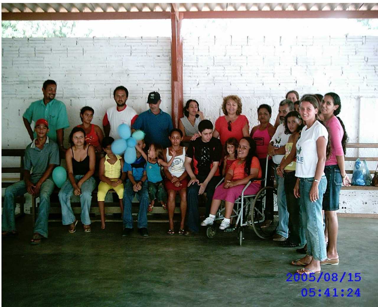
Primeiro dia de atividade

Ourilândia do Norte - Pa. Fevereiro/2024